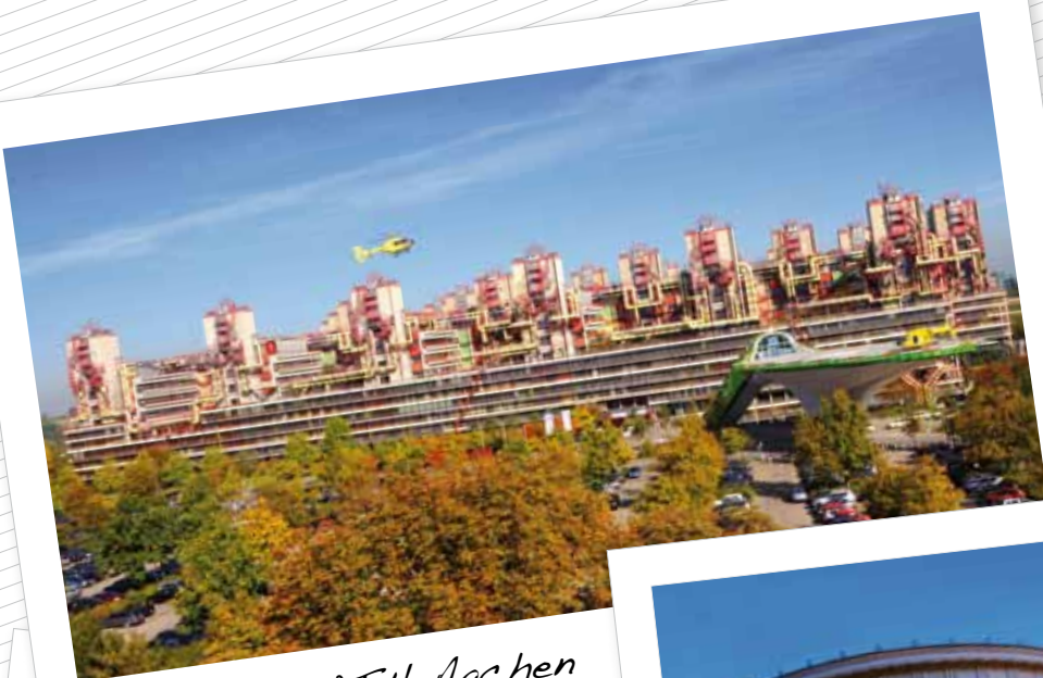
Uniklinik RWTH Aachen